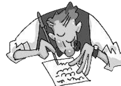
Figura 1 - O escritor